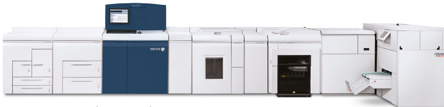
Sistema de Produção Xerox Nuvera® 157 EA com Xerox® Production Stacker e Watkiss PowerSquare 224