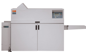
C.P. Bourg BDFNx Booklet Maker