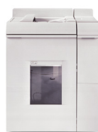
Módulo de finalização básico