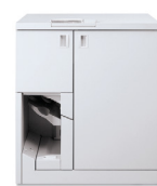
Encadernador de fita Xerox®