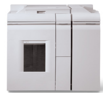
Módulo de finalização básico – ligação directa