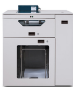
Alimentador C.P. Bourg BSFx Dual-Mode