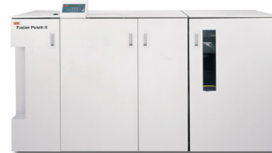
GBC® FusionPunch® II com Offset Stacker