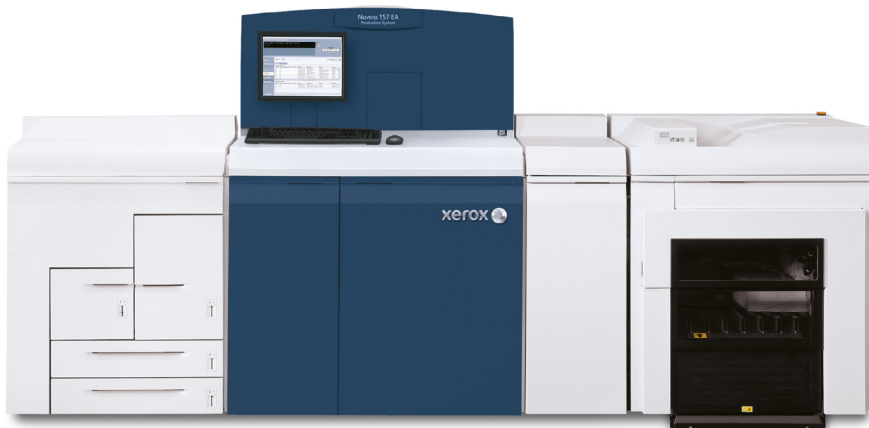
Sistema de Produção Xerox Nuvera® 157 EA com Empilhador Xerox® Production