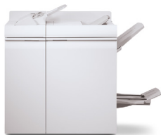
Finalizador multifunções Pro Plus