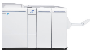
Plockmatic Pro 50/35 Booklet Maker (Disponível apenas no 120/144/157)