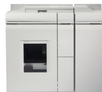
Módulo de Finalização Básica Plus