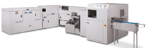
Xerox® Book Factory